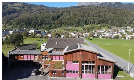
Werkhof mit Kanzlei