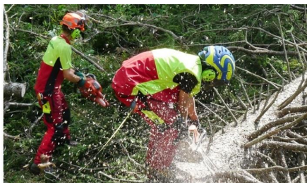
Forstgruppe mit Sägerei